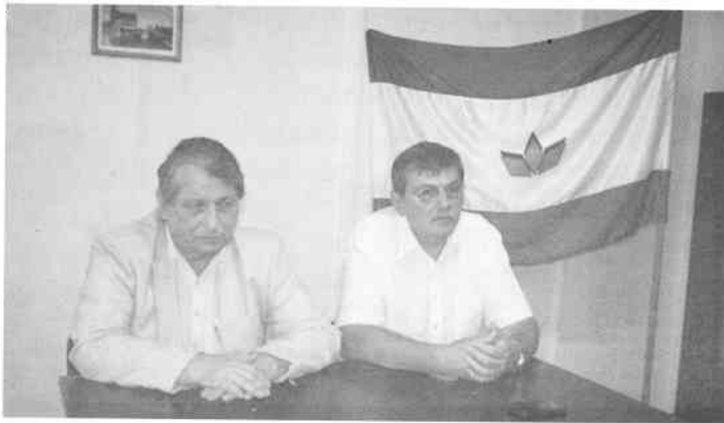
Marosvásárhely lehet a régió fővárosa