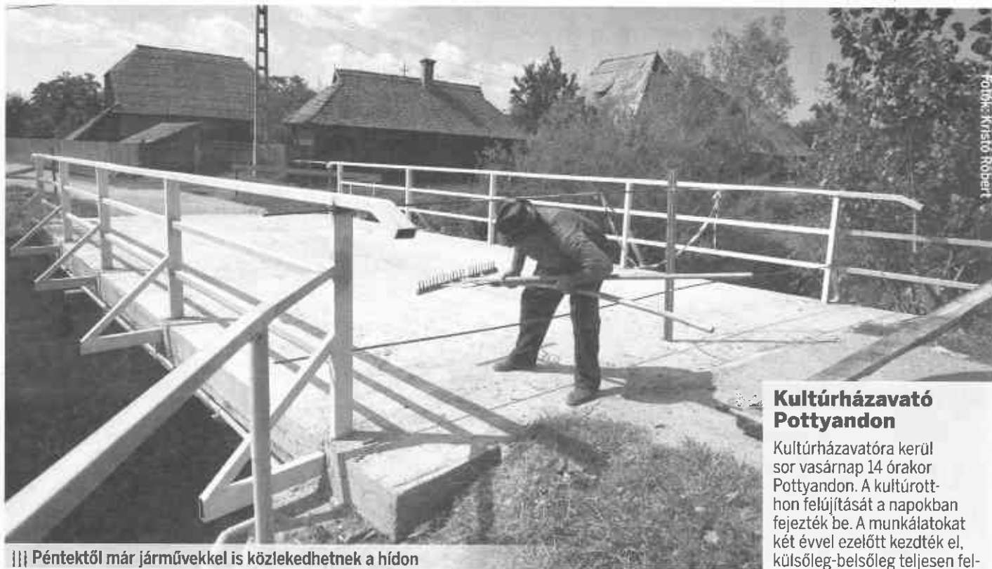
||| Péntektől már járművekkel is közlekedhetnek a hídon

Az elöljáró elmondta: a híd átadására péntek délben kerül