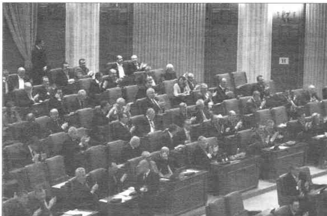
A többségi választási rendszer bevezetése megnegyedelné az RMDSZ parlamenti képviselőinek számát

„Bár tárgyaltunk a koalícióban a parlamenti és helyhatósági választások összevonásáról, egyelőre még nem döntöttünk. Olyan választási rendszerre van szükségünk, amely garantálja a leadott szavazatok parlamenti mandátummá való konvertálását” – mondta el Kelemen. Hozzátette: egy igazságos választási rendszer arányos képviseletet biztosít, nem vesznek kárba szavazatok. „A vegyes választási rendszert támogatjuk, ugyanis az egyéni választókerületekben mandátumot nyert képviselők mellett az országos listáról is be lehet jutni a törvényhozásba” – fogalmazott a szövetségi elnök. Hozzátette: az RMDSZ nem szabja majd feltételként a vegyes választási rendszer megtartását a helyhatósági és parlamenti választások összevonásának tárgyalásakor.