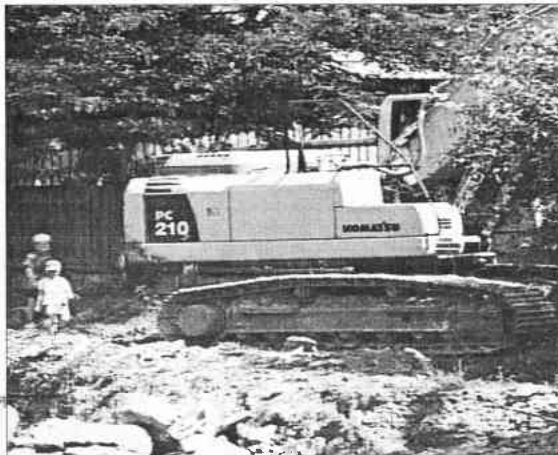
Hozáfogtak a meder kotrásához a munkagépek

A helyiek az idén sem uszták meg szárazon, néhány hete az összes eddiginél nagyobb árhullám zúdult végig a településen, nemcsak gazdasági épületeket, termőföldeket öntött el a víz, hanem lakóházakat is. Az áldatlan állapot fő oka a község kedvezőtlen földrajzi fekvése, ugyanis a falvakat tölcserként ölelik körül a magas hegyek. Ehhez társulnak az elmúlt évekre jellemző szélsőséges, kis területen lehulló, bővizű záporok-