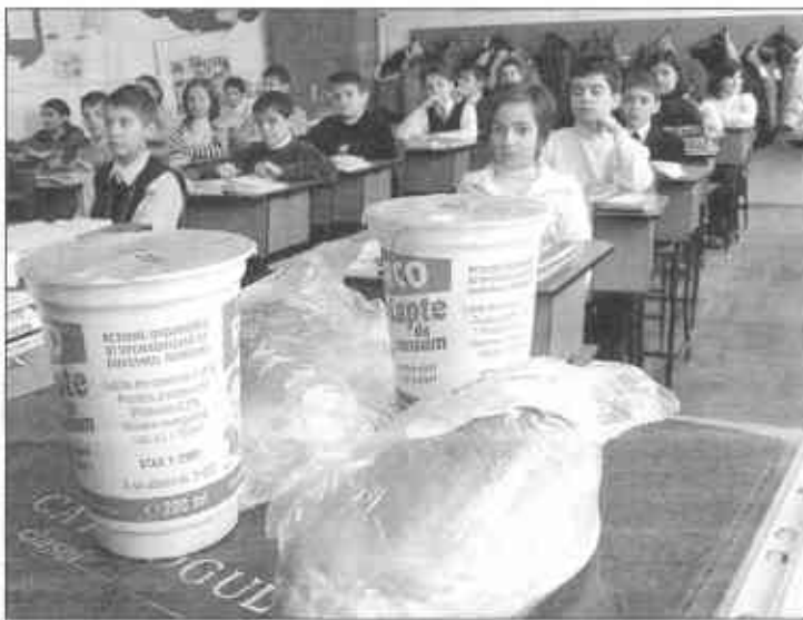
Van, ahol elmarad. Nem minden diák kap már első nap tejet és kiflit